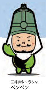
三井寺キャラクター ペンペン

後援/関東大道芸研究会・滋賀県バルーンアート協会・滋賀県江州音頭保存会・ 滋賀県南京玉すだれ保存会・ちんどん屋こうあん一座・さざなみ太鼓・ ていだkankan・ききょうちゃん一座・伊吹山ガマの油口上保存会・ 待(まつ)コミュニケーション・紙芝居夢屋商店・よさこい元気隊・ 夢華会・花架拳・ふじの木茶屋